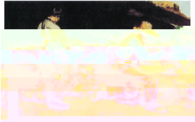
石工 (油画, 1849年) 库尔贝 (法国)